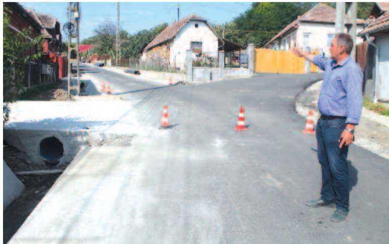
Az aszfaltozott Sáros utca

A hivatalos ünnepnapot megtoldó szabadnapokon a szőkefalvi Állomás utcát aszfaltozták a harminc fok fölötti hőségben. Egymeternyi távolságból is áradt a frissen öntött, egyenletesen csillogó, szurok és zúzott kő elegyből álló aszfaltból a forróság, a távolabb eső szakaszokon délibábossá vált a párolgó aszfalt. Amint a munkálatot végző cég csoportvezetője elmondta, a 180 Celsius-fokos folyékony bitumen kötőanyagot, közútalékot, homokot és más adalékanyagokat tartalmazó aszfaltot Balázsfalváról szállítják. 175 fokon érkezik a helyszínre, az úthengerrel való egyengetés pillanatában pedig 150-160 Celsius-fokos a leterítésre váró folyékony aszfalt hőmérséklete.