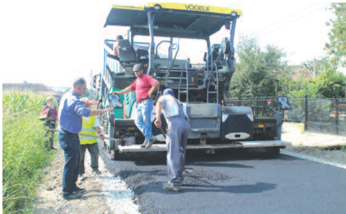
A szőkefalvi Állomás utca aszfaltozása

községi bekötőtűt – a DC 79, mely a 142-es számú megyei útra csatlakozik – 1038 méter. A márciusban megkezdett munkálatok befejezésének határideje jövő év januárja, de e hónap végéig befejezik a kolozsvári Drumasco Kft. által tervezett, a balázsfalvi Prenis Kft. által kivitelezett útépítést. Az országos vidékfejlesztési program keretében az aszfaltozással egyidejűleg a mellékutcák mentén húzódó sáncokat mélyítik és kibetonozzák, vízlepcsőket alakítanak ki, ahol szükséges, támfalakat is építenek. Az árvízveszélyes helyeken az ingatlanok elé betonhidakat készítenek – a vízhozam függvényében kisebb vagy nagyobb átmérőjű gyűrűkkel –, így nagyobb esőzésekkor nem kell áradástól tartani.