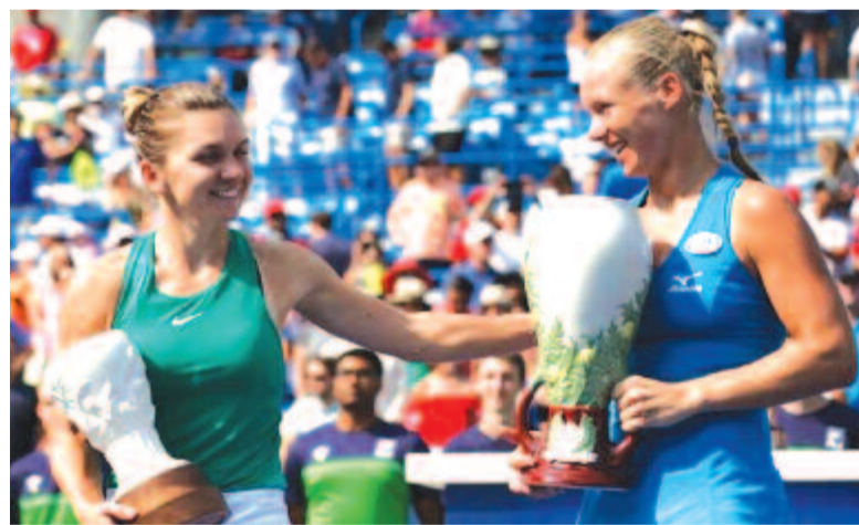
A világegyetem első román teniszező (b) láthatóan elfáradt a végére mentálisan is, így gratulálnia kellett a végén ellenfelének

A férfitorna eredménye: Novak Djokovic (szerb) – Roger Federer (svájci) 6:4, 6:4.