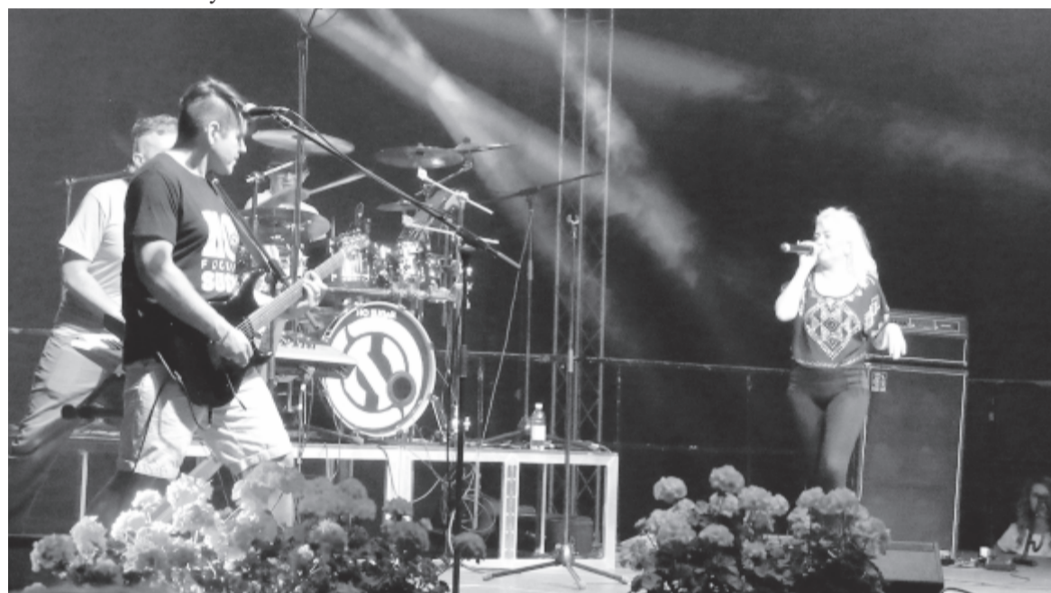
Koncertek, kulturális és sportprogramok színesítették az ákosfalvi hétfévét