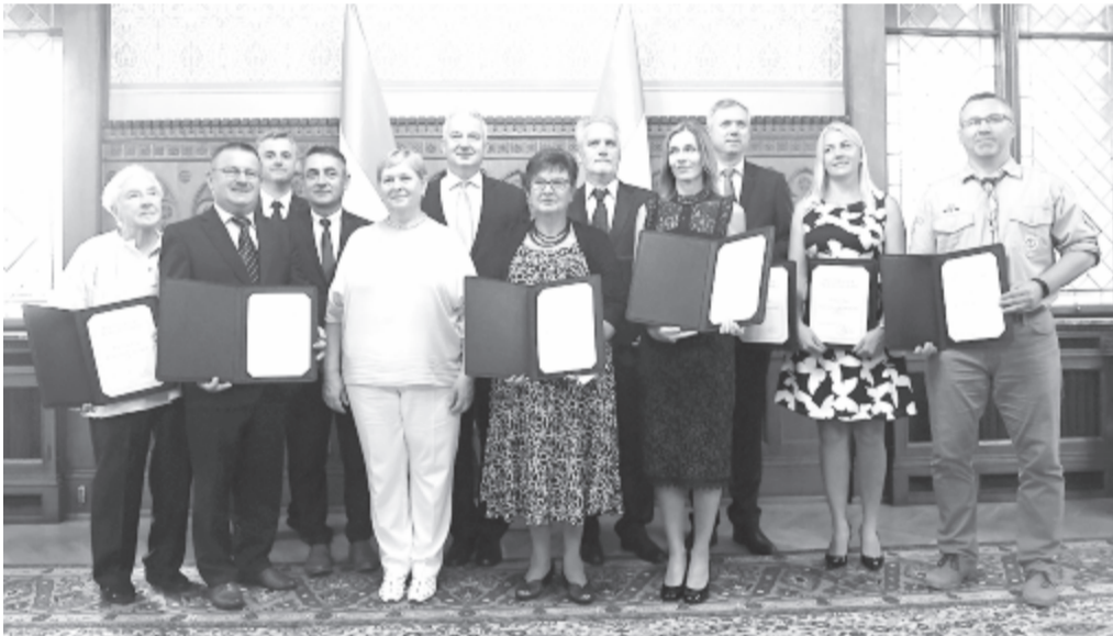
A díjazottak, valamint Semjén Zsolt és Potápi Árpád János a Külhoni Magyarságért Díjak ünnepélyes átadásán a Parlamentben